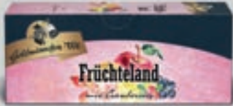
Fruchteland mit Cranberries DI280 25 Beutel (56g) 1,89€ (2,83€/100g)