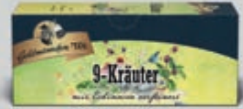
9-Kräuter mit Echinacea DI290 25 Beutel (37g) 1,89€ (4,24€/100g)