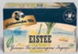
Eistee Grüner Tee-Lemongras-Ingwer DI323 20 Beutel (30g) 2,89€ (9,63€/100 g)