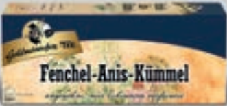
Fenchel-Anis-Kümmel DI300 25 Beutel (50g) 1,89€ (3,18€/100g)