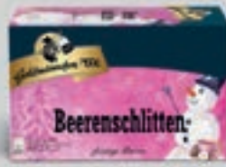
Beerenschlitten Früchtetee DI392 20 Beutel (50g) 2,69€ (5,38€/100g)