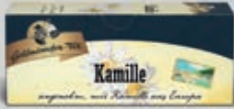
Kamille aus Europa DI250 25 Beutel (35g) 1,89€ (4,54€/100g)