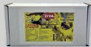
Gelée Royale DI150 30 Ampullen 44,60€ (1,49€/Stk.)