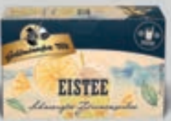
Eistee Schwarztee-Zitronensorbet DI322 20 Beutel (36g) 2,89€ (8,03€/100 g)