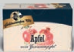
Apfel mit Granatapfel DI260 20 Beutel (45g) 2,59€ (5,76€/100 g)