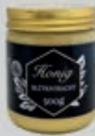
Blütentracht DI122 500g Glas 6,70€ (13,40€/Stk.)