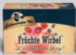
Früchte Wirbel DI331 20 Beutel (57g) 2,79€ (4,89€/100 g)