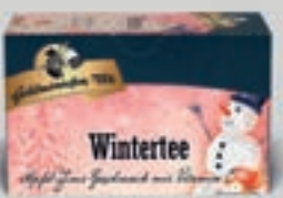
Wintertee Apfel-Zimt-Geschmack DI357 20 Beutel (50g) 2,59€ (5,18€/100 g)