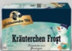
Kräuterchen Frost Kräutertee DI394 20 Beutel (40g) 2,69€ (6,73€/100g)