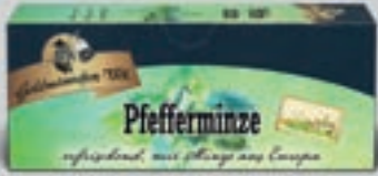
Pfefferminze aus Europa DI240 25 Beutel (45g) 1,89€ (3,53€/100g)