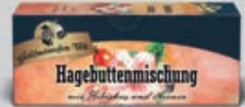
Hagebuttenmischung DI230 25 Beutel (62g) 1,89€ (2,54€/100 g)