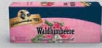
Waldhimbeere DI360 25 Beutel (56g) 1,89€ (3,36€/100 g)