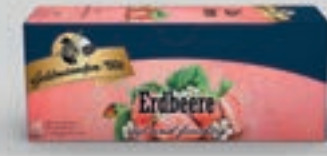
Erdbeere DI350 25 Beutel (56g) 1,89€ (3,36€/100 g)