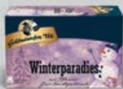
Winterparadies Früchtetee DI391 20 Beutel (50g) 2,69€ (5,38€/100g)