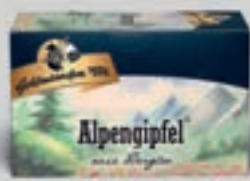
Alpenglühel mit Bergtee DI324 20 Beutel (32g) 2,79€ (8,72€/100g)