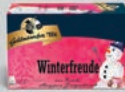
Winterfreude Früchtetee DI393 20 Beutel (45g) 2,69€ (5,98€/100g)