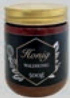
Waldhonig DI121 500g Glas 7,50€ (15,00€/kg)