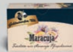
Maracuja mit Pfirsicharoma DI320 20 Beutel (40g) 2,59€ (6,48€/100 g)