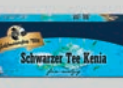
Schwarzer Tee aus Kenia DI334 25 Beutel (37,5g) 1,89€ (5,04€/100 g)