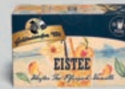
Eistee Weißer Tee-Pfirsich-Vanille DI325 20 Beutel (30g) 2,89€ (9,63€/100 g)