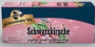
Schwarzkirsche DI310 25 Beutel (50g) 1,89€ (3,78€/100g)