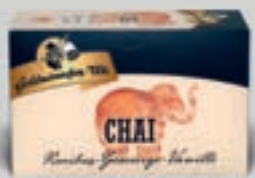
Chai Rooibos-Gewürz-Vanille DI359 20 Beutel (40g) 2,79€ (6,98€/100g)