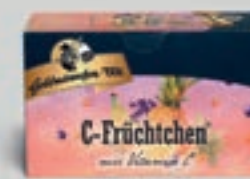
C-Früchtchen mit Vitamin C DI321 20 Beutel (50g) 2,79€ (5,58€/100 g)