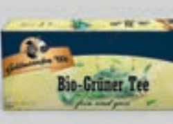
Bio Grüner Tee DI335 25 Beutel (37g) 1,89€ (4,24€/100 g)