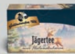
Jägertee mit Holunderbeeren DI222 20 Beutel (50g) 2,79€ (5,58€/100 g)